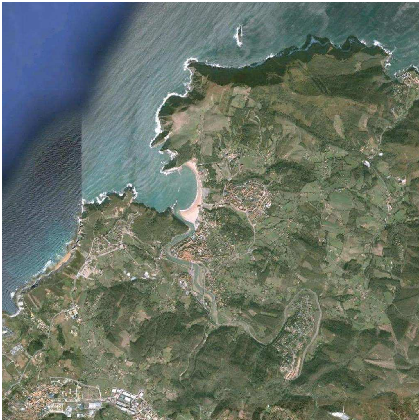
Figura 1. Vista general del entorno costero alrededor del estuario del río Butrón (Bizkaia). Escala 1:30.000 aprox.