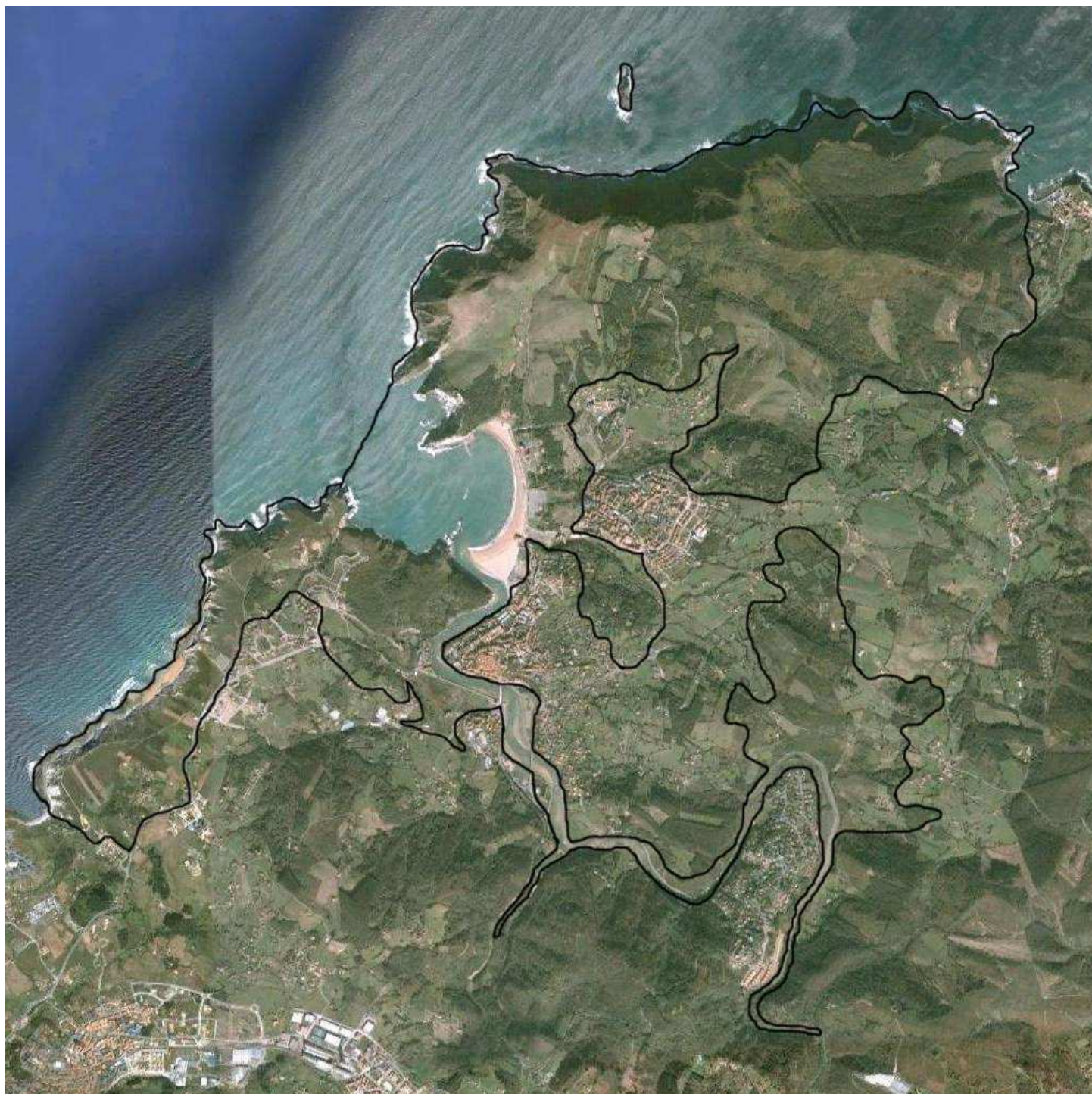
Figura 2. Perímetro de la propuesta Conjunto de Biotopos de Uribe Kosta Butrón (UKB) (Bizkaia). Escala 1:30.000 aprox.